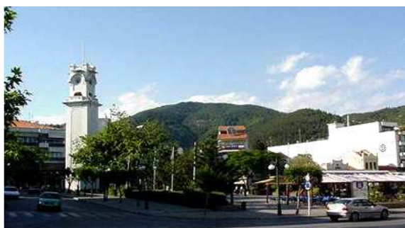
Φωτ. 1 Λεζάντα φωτογραφίας Arial 10pt πλάγια

Για καλύτερη επεξεργασία και μεταφορά των σχημάτων, εικόνων και φωτογραφιών κατά την εκτύπωση να προτιμηθεί *.jpeg format.