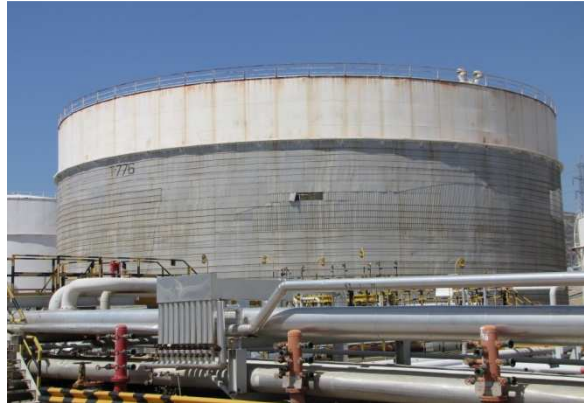
Φωτ. 1- Φωτογραφική λήψη δεξαμενής T-776

Μια ρεαλιστική παρουσίαση των δεξαμενών γίνεται μέσω φωτογραφιών που λήφθηκαν στις εγκαταστάσεις της ΜΟΤΟΡΟΪΛ ΕΛΛΑΣ, Διυλιστήρια Κορίνθου Α.Ε. Στη Φωτογραφία 1 παρουσιάζεται η δεξαμενή T-776, ενώ η δεξαμενή T-761 διακρίνεται στη Φωτογραφία 2.