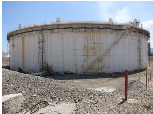
Φωτ. 2- Φωτογραφική λήψη δεξαμενής T-761