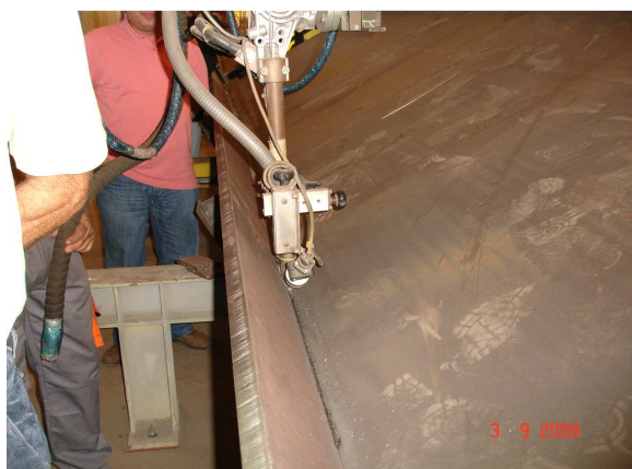
Φωτ. 4 Συγκόλληση Κάτω πέλματος δοκού με S.A.W.

Η εργοστασιακή παραγωγή των στοιχείων του μεταλλικού φορέα πραγματοποιήθηκε σε εξειδικευμένο εργοστάσιο στην Λάρισα από την εταιρεία ΙΝΤΡΑΚΑΤ Α.Ε.. Η παραγωγή των υψίκορμων σύνθετων μεταλλικών δοκών, που παρουσιάζεται στην Φωτ. 4, έγινε σε αυτόματη μηχανή συγκόλλησης με συνδέσεις πελμάτων/κορμού με αμφίπλευρη συνεχή εξωραφή κατάλληλου πάχους (παραλαβή του 100% της διατμητικής ροής) με την διαδικασία του βυθιζόμενου τόξου (S.A.W). Τα ελάσματα ακαμψίας (διαμήκη και εγκάρσια) των κυρίων δοκών τοποθετήθηκαν στο εργοστάσιο παραγωγής με συγκολλήσεις εξωραφές κατάλληλου πάχους. Η σύμμικτη λειτουργία του φορέα μεταξύ μεταλλικού σκελετού και πλάκα καταστρώματος επιτυγχάνεται μέσω διατμητικών ήλων συγκολλημένων στο εργοστάσιο παραγωγής στα άνω πέλματα όλων των δοκών. Η διατμητική σύνδεση θεωρείται πλήρης 100%.