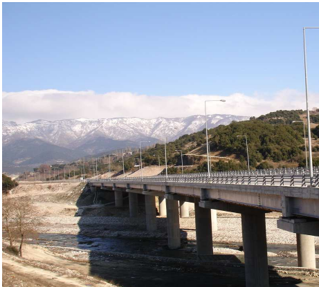
Φωτ. 1 Γέφυρα T10, της Εγνατίας οδού

Η διατομή του φορέα ανωδομής της Γέφυρας T10 για κάθε κλάδο είναι σύμμικτη και αποτελείται από έξι (6) σύνθετες χαλυβδοδοκούς μορφής διπλού T, ύψους 1,50μ. συνδεμένες ανά δύο μεταξύ τους σε ζεύγματα από σύνθετες μεταλλικές διατομές και έγχυτη πλάκα καταστρώματος από οπλισμένο σκυρόδεμα (Σχ. 1). Η πλάκα σκυροδετείται πάνω σε τραπεζοειδείς λαμαρίνες τύπου KONTI - KSH 100, πάχους 1χιλ. Το συνολικό πλάτος της άνω πλάκας είναι 14,45μ. Το ελάχιστο συνολικό πάχος της πλάκας καταστρώματος είναι 25εκ. (μαζί με τις τραπεζοειδείς λαμαρίνες).