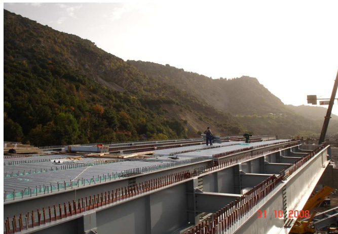
Φωτ. 5 Ανέγερση Μεταλλικών Δοκαριών

Συνολικά προβλέπεται η συναρμολόγηση οκτώ (8) τμημάτων, συνολικού μήκους 288,0μ (8x36,0μ.) για την ολοκλήρωση του μεταλλικού φορέως ανωδομής εκάστου κλάδου. Κάθε κλάδος αποτελείται από έξι (6) σειρές κύριων μεταλλικών δοκών μορφής διπλού T ύψους 1,50μ.