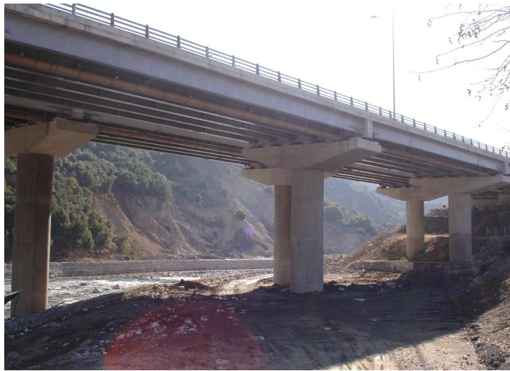
Φωτ. 6 Γέφυρα T10, τμήμα 2.4 της Εγνατίας οδού

Μετά τη σκλήρυνση και της δεύτερης φάσης σκυροδέτησης αφαιρούνται οι προσωρινές στηρίξεις (με τοπική ανύψωση του καταστρώματος μέχρι 5 mm ή και χωρίς ανύψωση) και μεταφέρεται η στήριξη στα οριστικά εφάδρανα, τα οποία έχουν ήδη πακτωθεί στη διαδοκίδα.