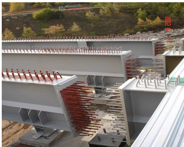
Φωτ. 2 Διαδοκίδα της Γέφυρας

Τα ελαστομεταλλικά εφεδράνα με πυρήνα μολύβδου κατασκευαστήκαν στην εταιρεία ALGA στην Ιταλία, όπου και πραγματοποιήθηκαν οι πρότυπες δοκιμές συμπεριφοράς για την επιβεβαίωση του καταστατικού νόμου συμπεριφοράς των. [4]