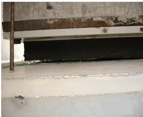
Φωτ. 3 Εφεδράνα της Γέφυρας T10