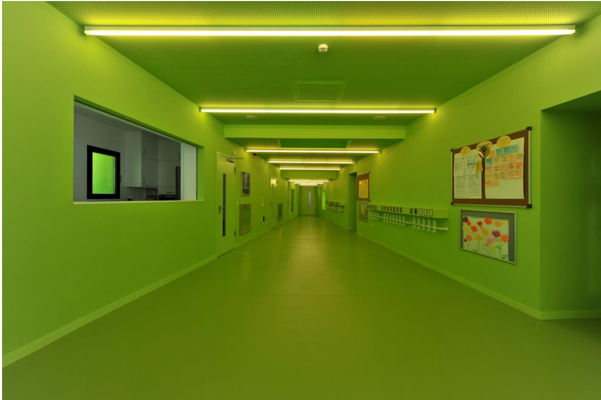
Σχήμα 6 Είσοδος – Χώρος Πολλαπλών Χρήσεων

ώρα της ημέρας και την εποχή, ενώ η μη κανονική διάταξή τους τα συμπαρασύρει σε ένα ασυνήθιστο παιχνίδι θέασης του άμεσου και μακρινού τοπίου.