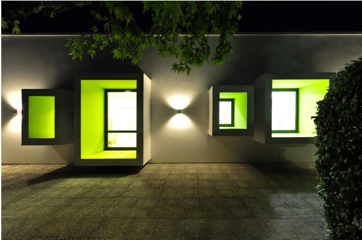
Σχήμα 4 Νυχτερινή Άποψη Λεπτομέρειας

εκπαιδευτική προσπάθεια κινητοποιώντας τα νοητικά και συναισθηματικά αντανακλαστικά του παιδιού, περιγράφει τον εννοιολογικό άξονα της “ιδέας”.