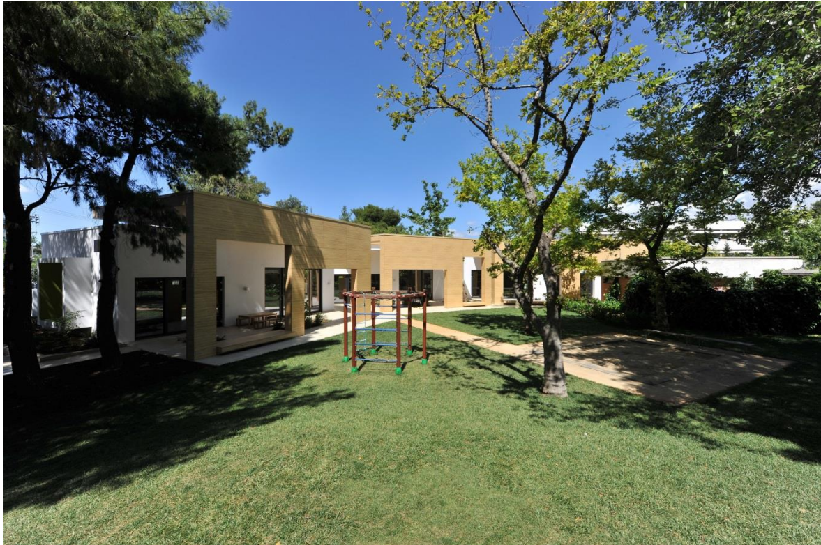
Σχήμα 3 Κεντρική Περιοχή Περιβάλλοντος Χώρου

Με απλά μέσα, επιδιώχθηκε η διασφάλιση οφέλους όσον αφορά, αφενός στην εξοικονόμηση ενέργειας, και, αφετέρου, στην δημιουργία συνθηκών οπτικής άνεσης στο εσωτερικό του κτιρίου. Έτσι, η ενισχυμένη θερμομόνωση του κελύφους μειώνει δραστικά τις απώλειες, ενώ τα σκίαστρα προφυλάσσουν τα εξωτερικά κουφώματα από τον δυσμενή νότιο προσανατολισμό προστατεύοντας τους κλειστούς χώρους από την υπερθέρμανση. Αντίστοιχα, τα κατακόρυφα στοιχεία σκίασης, όπου αυτό απαιτείται, προφυλάσσουν το εσωτερικό του Νηπιαγωγείου από τον ανατολικό και δυτικό ήλιο. Οι αντιδιαμετρικές διατάξεις των εξωτερικών ανοιγμάτων – σε συνδυασμό με τα ηλεκτρικά ανοιγόμενα skylights – ευνοούν τον διαμπερή φυσικό αερισμό των εσωτερικών χώρων. Μία συστοιχία skylights επιτρέπει, με έμμεσο τρόπο, την είσοδο του φυσικού φωτός στους κλειστούς χώρους, συμβάλλοντας στη δημιουργία συνθηκών οπτικής άνεσης.