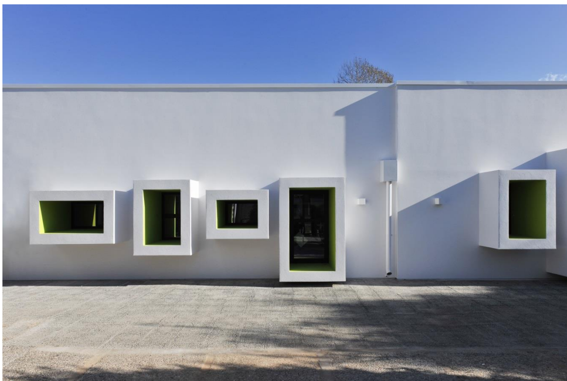
Σχήμα 1 Δυτική Όψη