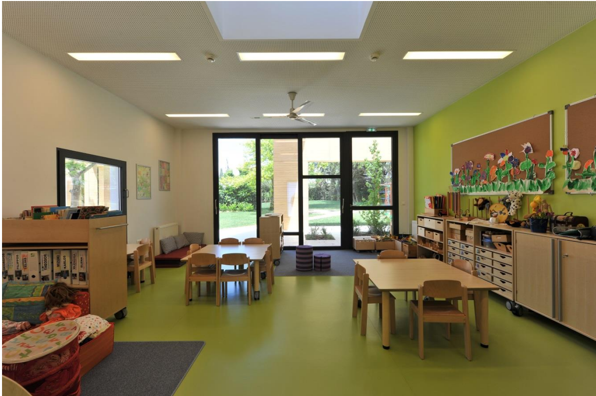
Σχήμα 7 Αίθουσα Διδασκαλίας

χώρο τους. Οι μικρές αυτές “φωλιές”, σε συνδυασμό με τις διάτρητες επιφάνειες σχήματος “Γ” των ημιπαιθριών χώρων που θυμίζουν θεατρικό σκηνικό, προσφέρουν ευκαιρίες για εξερεύνηση, οικοποίηση και παιχνίδι, ενόσω επιτρέπουν στον μικρό μαθητή να κατανοήσει τη λογική των επιμέρους κατασκευών από τις οποίες συγκροτείται ένα οικοδόμημα. Παράλληλα αναγγέλλουν τις χωρικές ποιότητες, μορφές και αναλογίες που μπορεί να γεννήσει η αρχιτεκτονική ποιητική, καθώς τον “ταξιδεύουν” από τον οργανωτικό ρόλο της κάτοψης στην εμπειρία της προοπτικής αίσθησης.