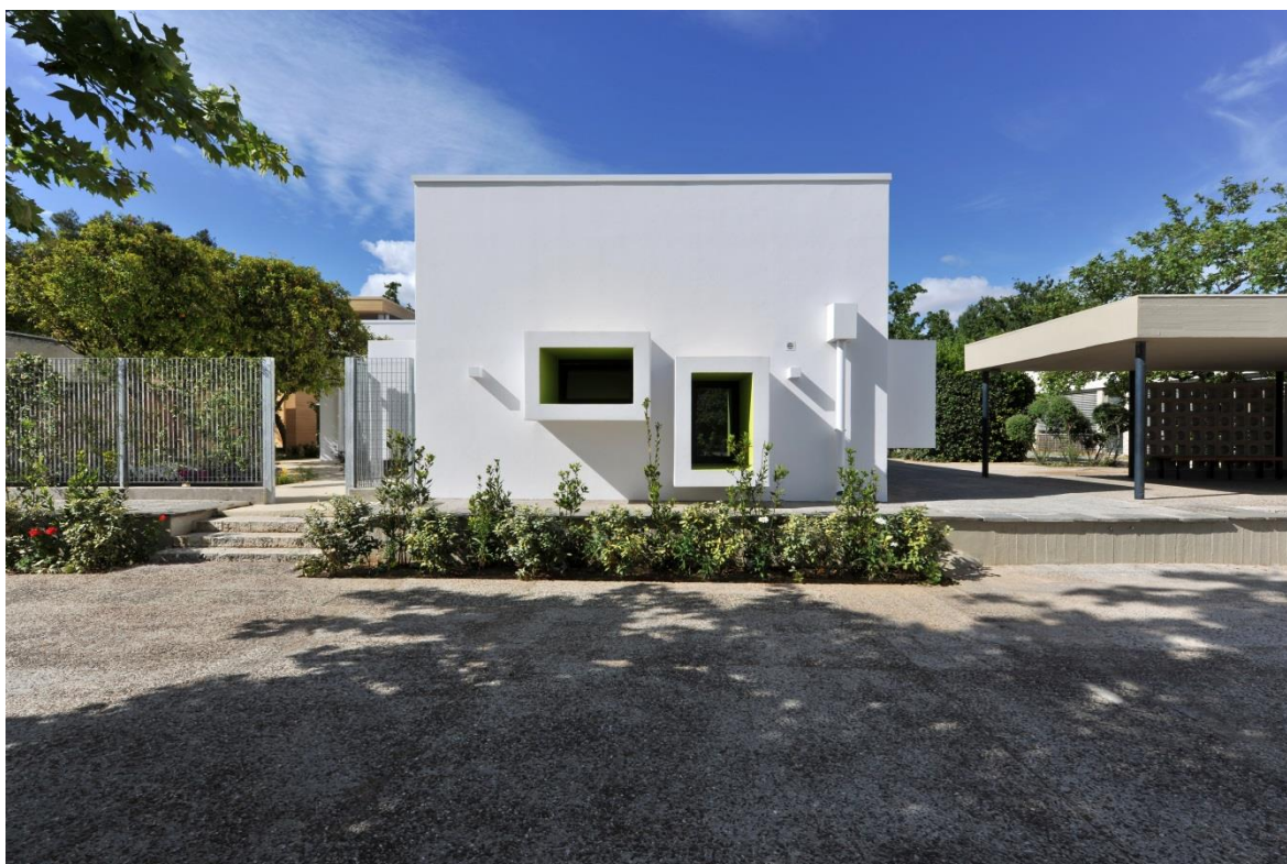
Σχήμα 2 Βόρεια Όψη

Η κύρια προσέγγιση του Νηπιαγωγείου πραγματοποιείται στο δυτικό μέρος του, από έναν εσωτερικό πεζόδρομο που εκτείνεται στην διεύθυνση βορρά – νότου. Από το ένα άκρο του, και συγκεκριμένα προς τον βορρά, ο άξονας αυτός επιτρέπει την σύνδεση του Νηπιαγωγείου με την κεντρική αυλή του συγκροτήματος της Γερμανικής Σχολής. Από το άλλο άκρο του, το νότιο, συνδέει το κτίριο με το υπαίθριο πάρκινγκ. Η είσοδος προς τους εσωτερικούς χώρους του Νηπιαγωγείου πραγματοποιείται από την δυτική πλευρά, κεντροβαρικά της κάτοψης. Μία δευτερεύουσα υπηρεσιακή είσοδος, στο βόρειο – ανατολικό μέρος του κτιρίου, επιτρέπει την εξυπηρέτηση των βοηθητικών του χώρων.